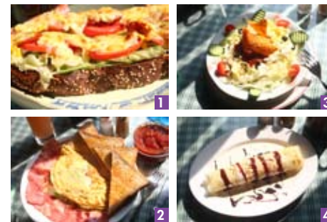
1.烤起司面三明治 以特製黑麥芽麵包製作的三明治，可搭配燻腿肉、火腿、培根，一口咬下真是料好味美。2.美式田園蛋捲 烤吐司、培根加上新鮮青椒、洋蔥、美生菜、蕃茄、蘑菇，滿滿元氣，可全天候供應。3.墨西哥脆餅沙拉 以nachos脆片鋪底，放上脆餅，搭配黑橄欖、蕃茄、小黃瓜以及特調的墨西哥辣醬，充滿視覺美感及味覺美味。4.法式香蕉薄餅 超人氣甜點下午茶，淋上鮮奶油和巧克力醬後，充滿幸福滋味。

在台南已有15年老字號口碑的綠屋，一直是道地美式餐飲的美食指標，也是台南老外客人最推薦的名店之一。